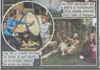
Une fois la bataille terminée, les braves se sont rabattus sur la comestible, utilisant les armes aux poignées.