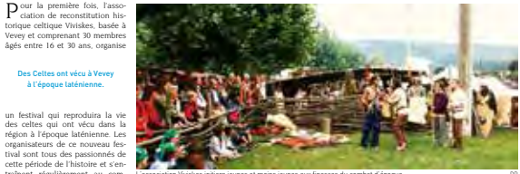
L'association Vivisico miliera jeunes et moins jeunes aux finesses du combat d'époque.

Festival Du 30 août au 1er septembre, les Celtiques de Vivisico se retrouveront sur le terrain de sport du quartier de Crédielles pour faire revivre le passé.