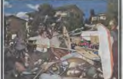
Les 2500 spectateurs ont eu droit à la reconstitution d'une bataille acharnée entre Celtes et Romains.