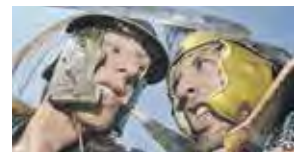
L'art de la guerre sera mis en scène pour revivre les batailles d'antan.

« Cette manifestation sera en toute circonstance, organisée sous la gouvernance d'Ardoipornv, qui assurera la gestion, l'entretien, l'entretien et la sécurité de l'événement. »