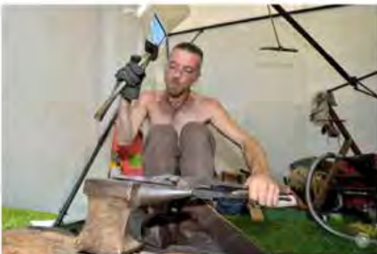
Les Celtiques de Vivisco ont attiré plus de 2'000 visiteurs en 2013. Ici, un fragment du travail.

« Cette manifestation sera en toute circonstance, organisée sous la gouvernance d'Ardoipornv, qui assurera la gestion, l'entretien, l'entretien et la sécurité de l'événement. »