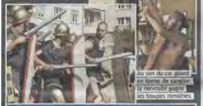
Au son du cor, ainsi en tenue de parade, la Nervia se défile dans les troupes romaines.

FESTIVAL Dans le cadre des Celtiques de Vivisico, Vevey s'est pris des airs de Petibonum, hier. Au menu, parades, défilés et même un affrontement (presque) sans merci entre légionnaires romains et guerriers celtes sans peur ni reproche.